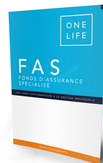
Le Fonds d'Assurance Spécialisé