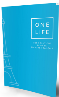
Nos solutions pour le marché français